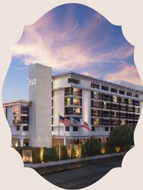
BEVERLY HILLS LOS ANGELES 2008