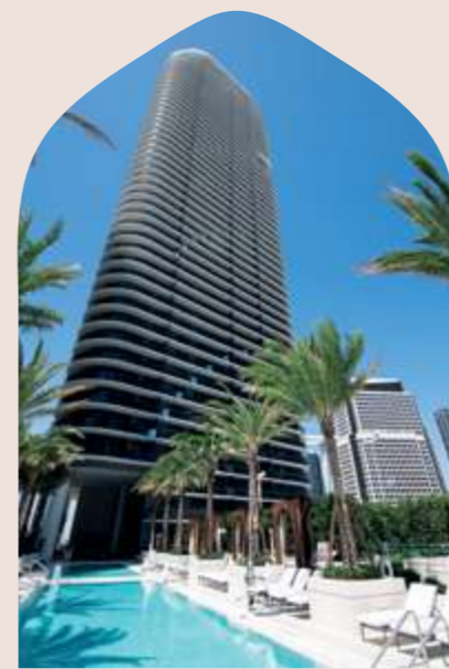
LUX BRICKELL MIAMI 2018