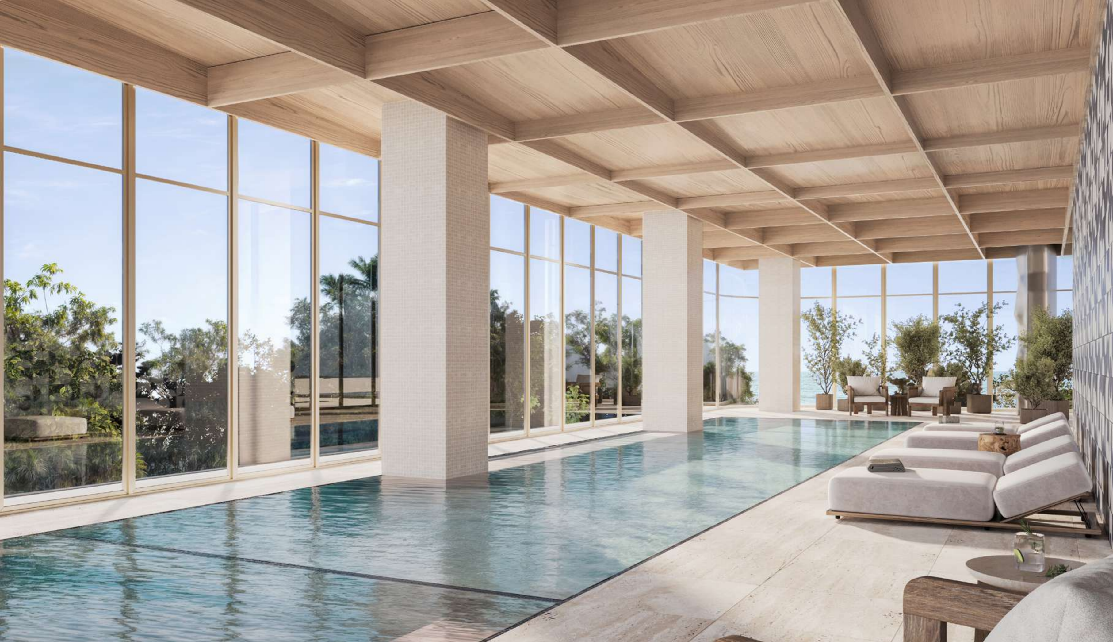
INDOOR POOL & RELAX AREA

Un espacio rodeado de vegetación interior y luz tenue, diseñado para nadar, desconectar y disfrutar del agua en cualquier momento del año.