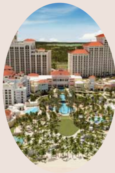
BAHA MAR NASSAU 2017