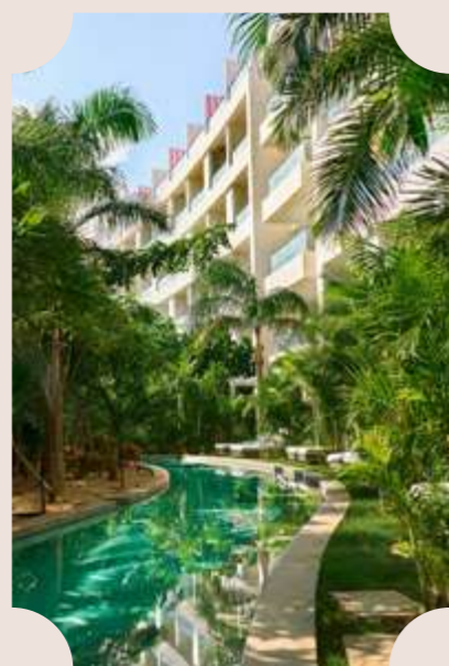
PLAYA MUJERES MÉXICO 2024