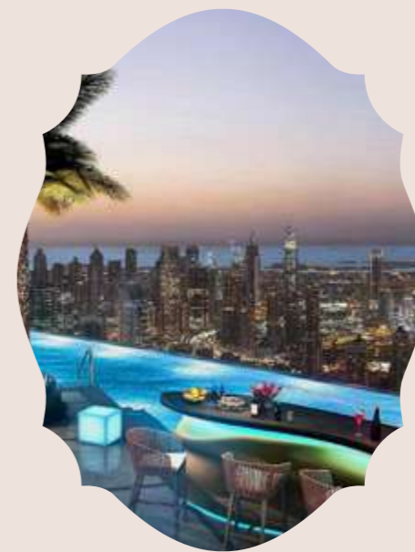
DUBAI UAE 2021