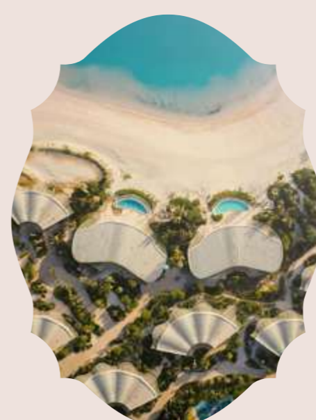
THE RED SEA ARABIA SAUDITA 2025