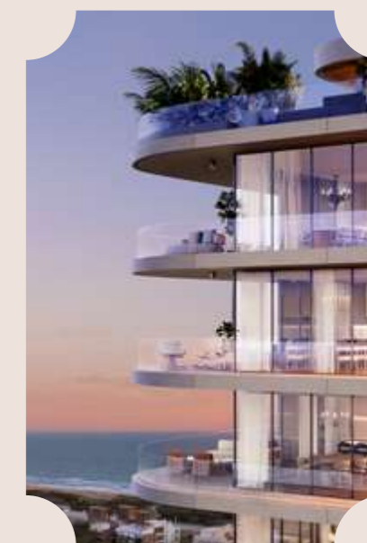
PUNTA DEL ESTE URUGUAY COMING SOON