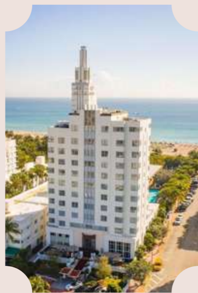
SOUTH BEACH MIAMI 2012