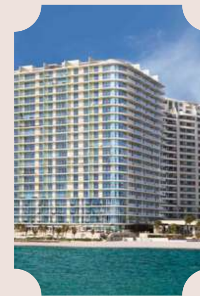
CANCÚN MÉXICO 2021