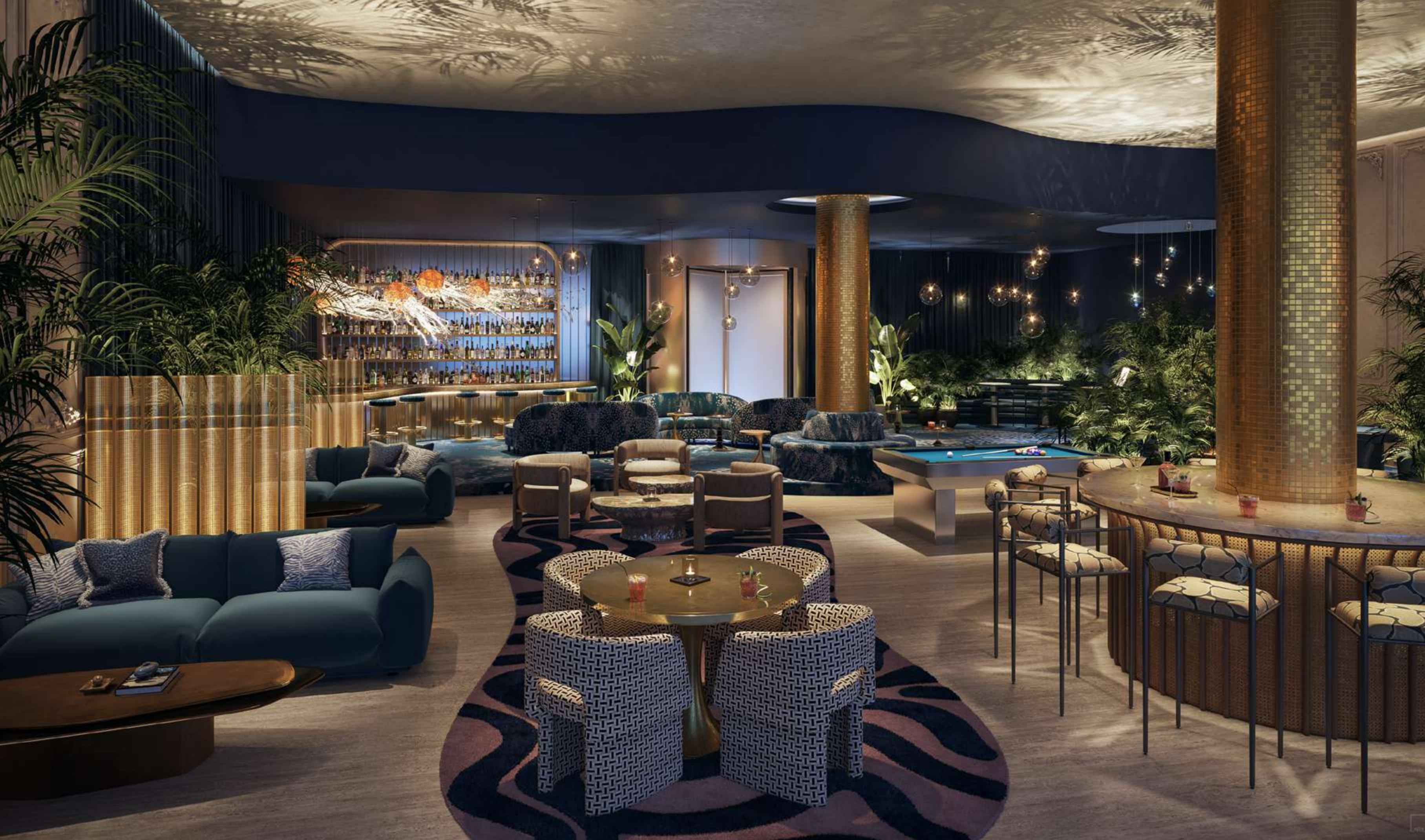
LOBBY LOUNGE & BUBBLE BAR

Un punto de encuentro diseñado para disfrutar de una copa y conectar con el momento, en un ambiente lleno de energía que invita a vivir experiencias inolvidables.