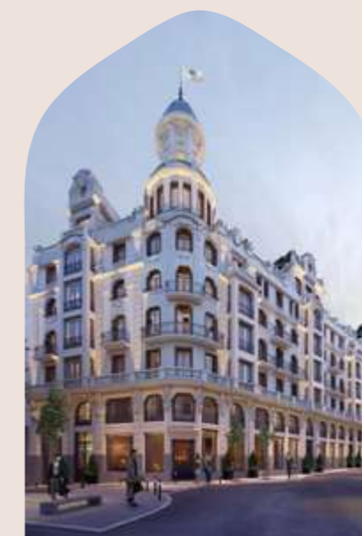
MADRID ESPAÑA COMING SOON