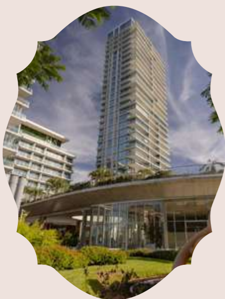
PUERTO MADERO ARGENTINA 2022