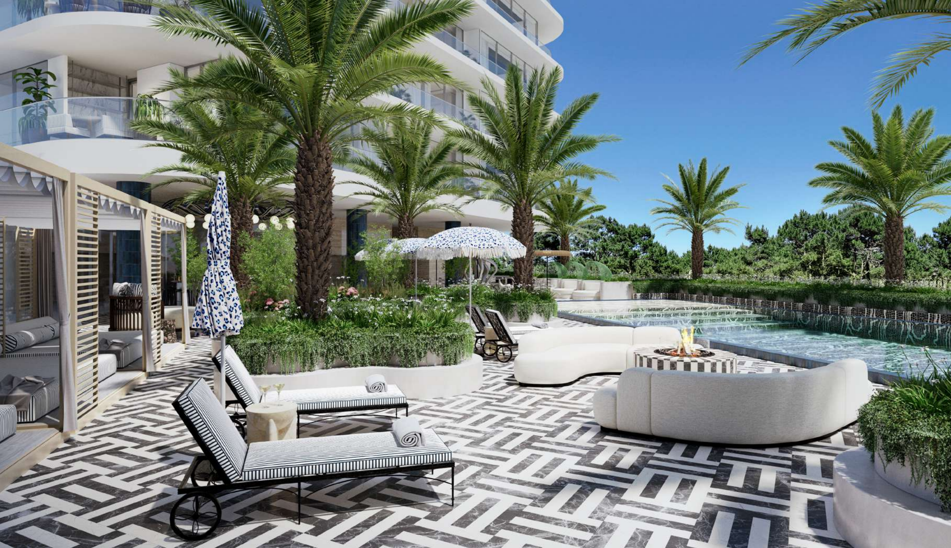
POOL GRILL & BAR

Un lugar ideal para disfrutar de momentos animados con la energía única de SLS. Un espacio vibrante que combina piscina y bar en un entorno dinámico.