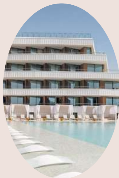
BARCELONA ESPAÑA 2025